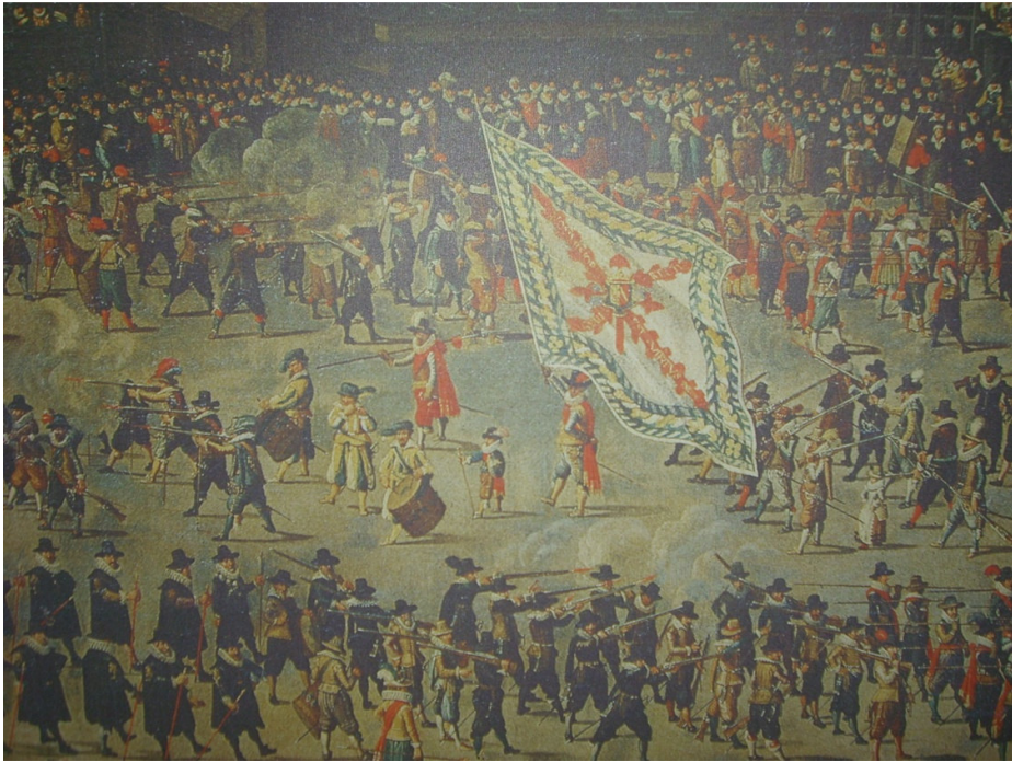
1615 Cortège des Serments sur le Grand-Place de Bruxelles.

Ce que le tableau de l'ommegang nous apprend :