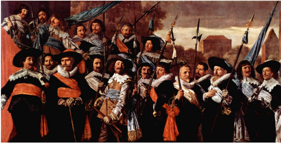
Cortège des officiers et des sous-officiers du corps des archers de Saint-Georges, 1639, huile sur toile, 218 x 421 cm (Frans Hals Museum, Haarlem).

Une récente émission télévisée sur arté au sujet la ronde de Nuit (Amsterdam 1642) de Rembrandt m'a appris que les gildes sont organisées autour d'un Capitaine, d'un lieutenant, d'un porte enseigne et de deux sergents.