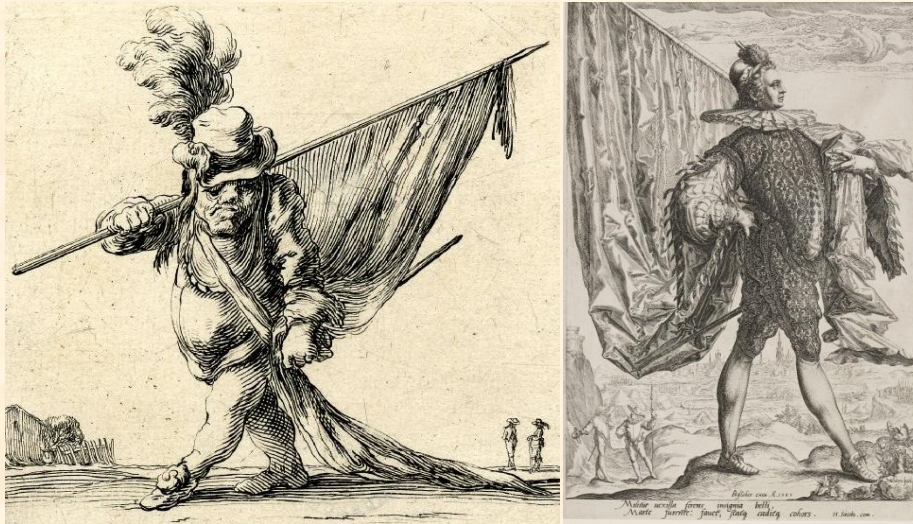
A gauche une gravure de Jacques Callot (graveur Français) 1634 A droite une gravure de Jacob de Gheyn Graveur des Pays bas 1589

Comme les gravures parlent d'elles même je n'en dirai pas plus