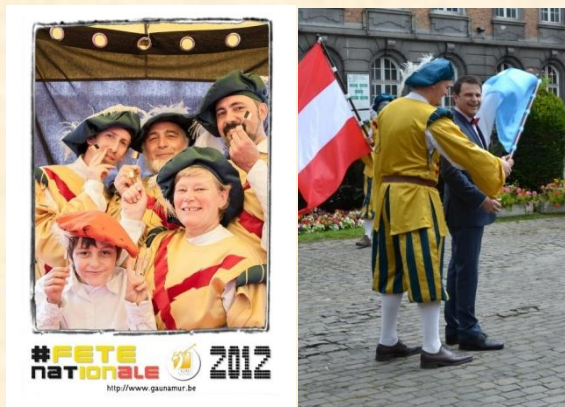
Quelques images au hasard