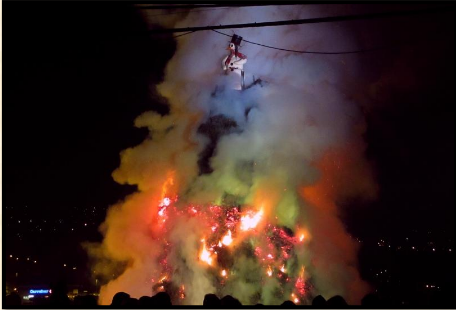
✓ Grand Feu de Bouge Février 2016