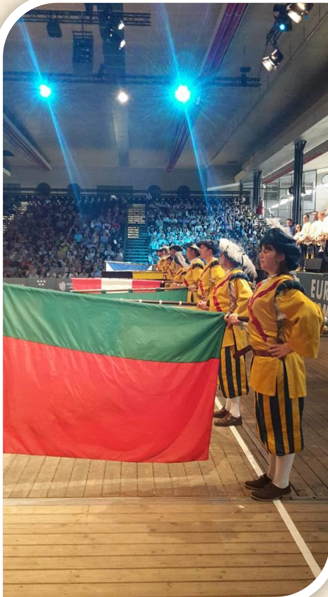
Jam Session : sympathique rencontre entre les différents lanceurs de drapeaux présents à l'europeade (ici : Namur, Kraainem, la Suisse et Zoersel)