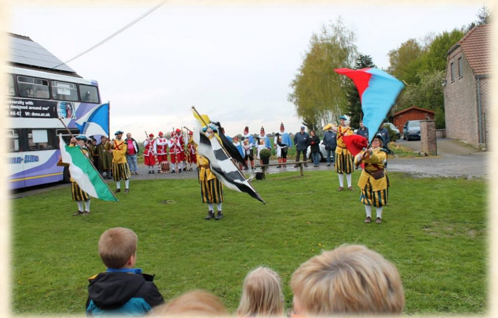
✓ Fiesse aux Boscailles Mai 2016