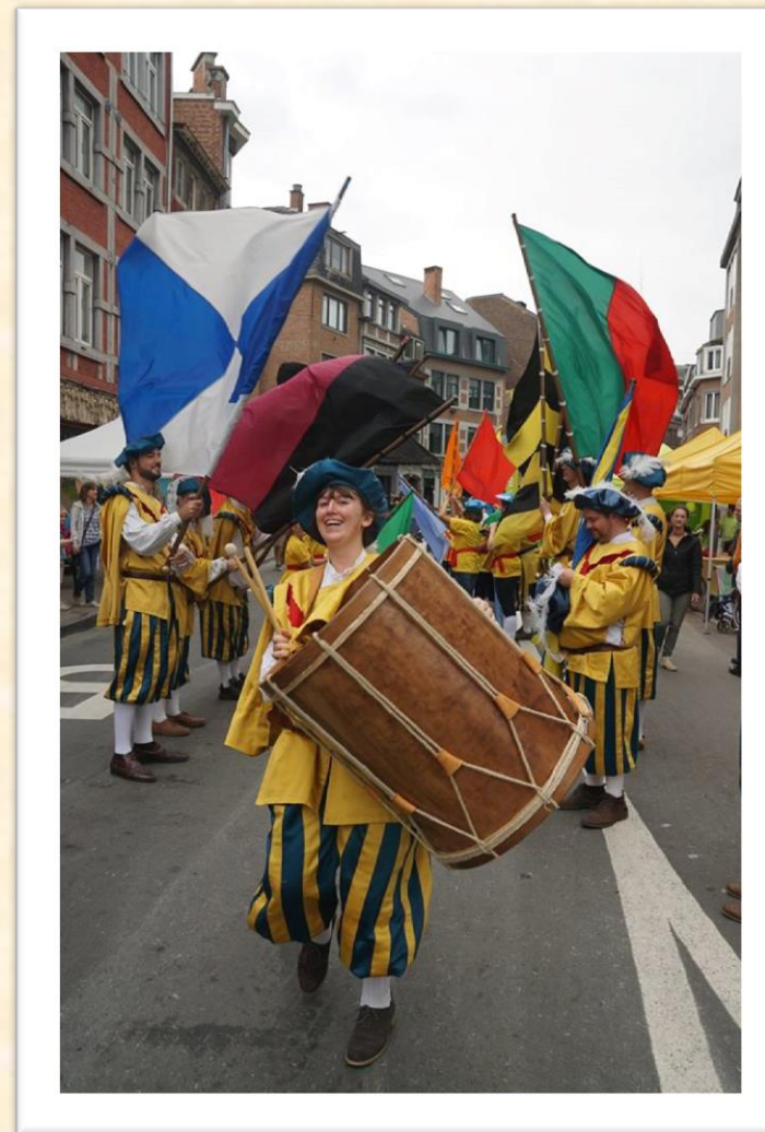
Cette photo est magique !