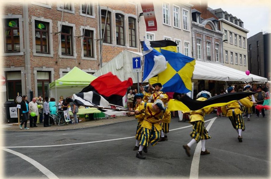
Petite interview radio entre 2 prestations, les stars sont fort demandées...